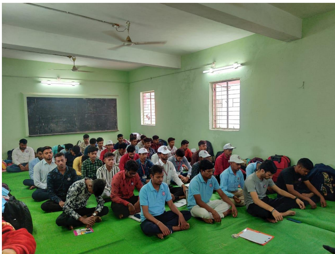
HFN PROGRAMME AT PIPERCHEDI, DISTRICT DURGA, AT NSS CAMP OF GOVERNMENT VYT PG AUTONOMOUS COLLEGE, DURGA

A number of 3-day workshops (duration of 1 hour a day, on consecutive days) for the Teachers, Students and Staff of various institutions were conducted during the session (The summary of events has been mentioned in the table). Aspirants were given first hand practical experience of the Heartfulness practices of relaxation, meditation, rejuvenation and inner connect during the workshops. These simple and effective heart-based practices enable the aspirants to develop holistic well-being.