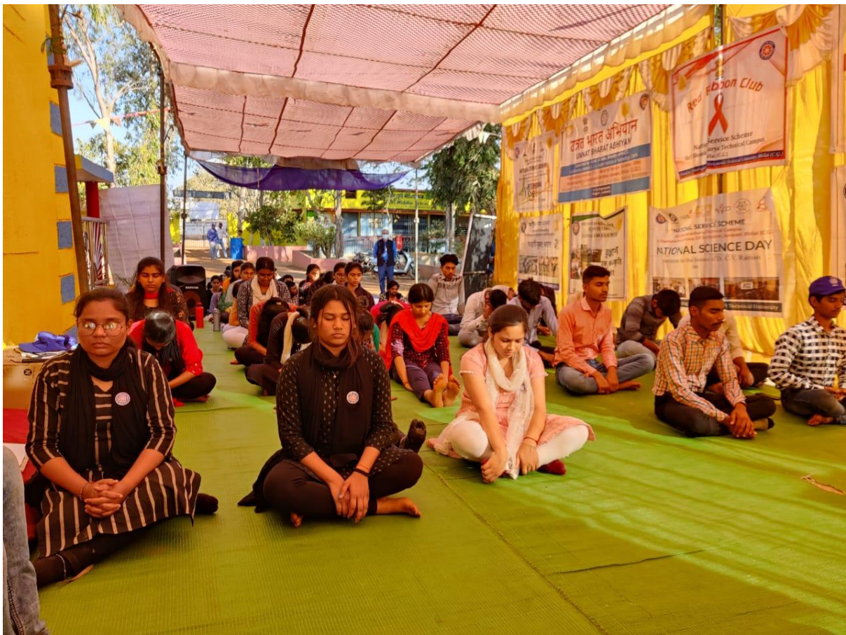
HFN WORKSHOP AT NSS CAMP AT ARASNARA, DISTRICT DURG, FOR STUDENTS OF SHRI SHANKARA TECHNICAL CAMPUS, BHILAI