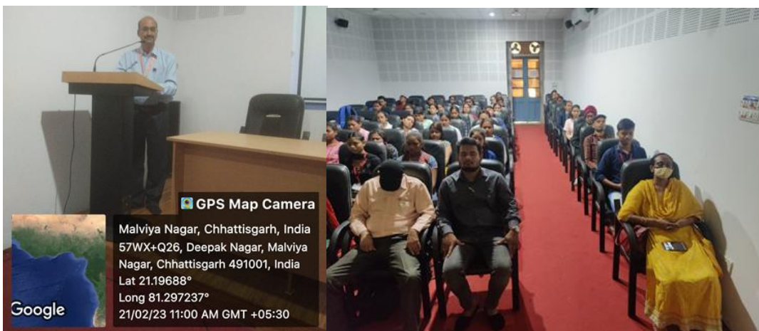
MEDITATION AND STRESS MANAGEMENT WORKSHOP ORGANIZED BY DEPARTMENT OF PSYCHOLOGY