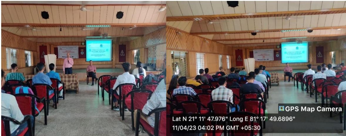
WORKSHOP ON LIFE SKILLS FOR YOUTH EMPOWERMENT ORGANIZED BY BHILAI INSTITUTE OF TECHNOLOGY, DURG