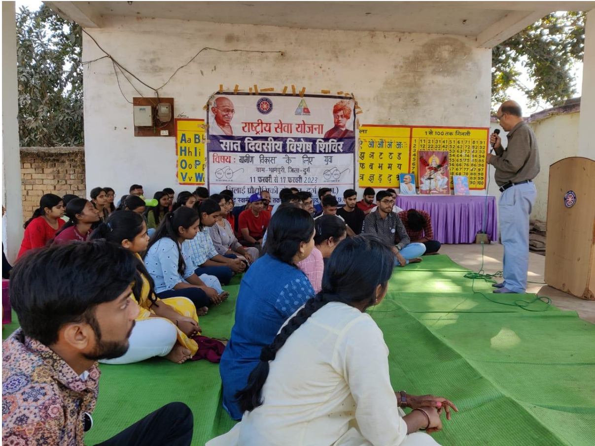
HFN WORKSHOP AT NSS CAMP AT BHANPURI, DISTRICT DURG, FOR STUDENTS OF BHILAI INSTITUTE OF TECHNOLOGY, DURG