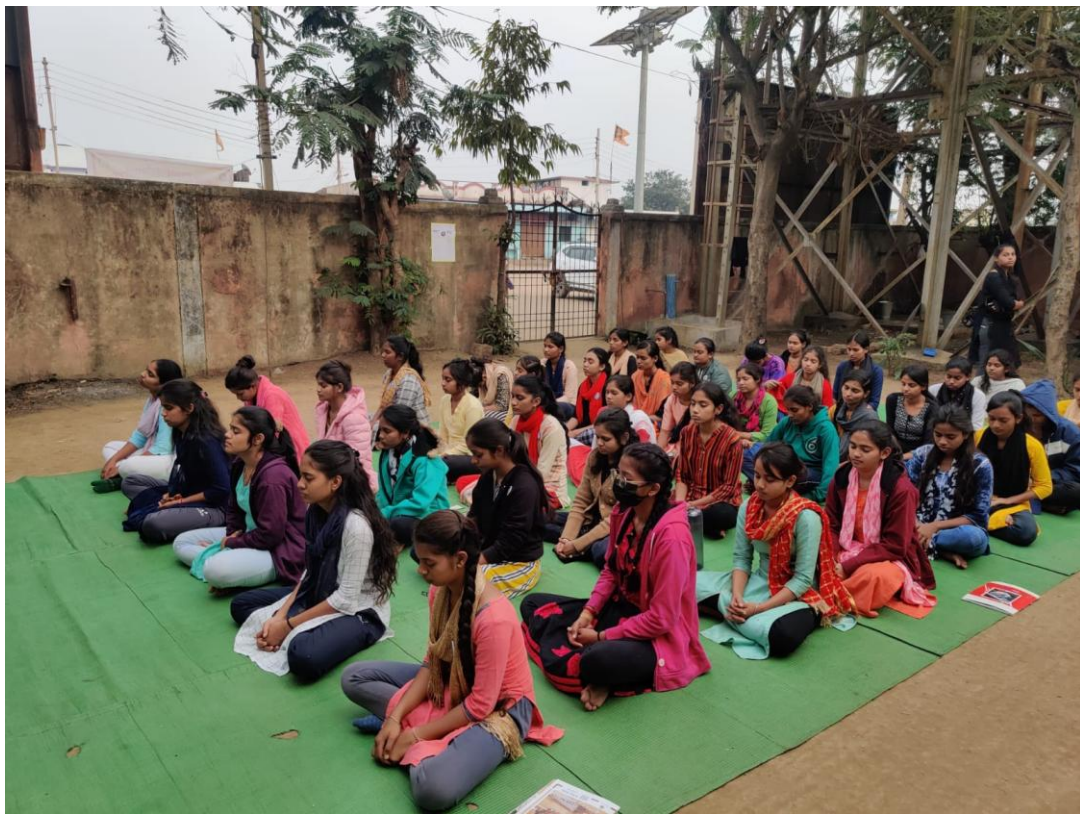
HFN PROGRAMME AT NSS CAMP AT KHAPRI, DISTRICT DURG FOR THE GIRLS UNIT OF GOVERNMENT VYT PG AUTONOMOUS COLLEGE, DURG